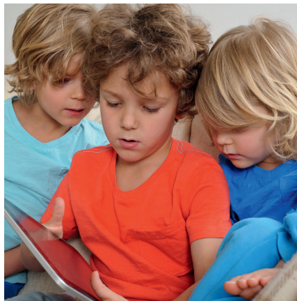
Tijdens het spelen raken de hoofden elkaar en kan hoofdluis zich verspreiden.

Hoofdluis heeft niets te maken met wel of niet schoon zijn. Het kan iedereen overkomen. Hoofdluizen lopen via het haar over van hoofd naar hoofd. Hoofdluizen zoeken graag een warm plekje op; bijvoorbeeld in het haar achter de oren, in de nek of onder een pony. Kinderen krijgen gemakkelijk hoofdluis, omdat tijdens het spelen de hoofden elkaar soms raken. Hoofdluizen verspreiden zich ook makkelijk bij pubers. Dat kan bijvoorbeeld gebeuren bij het knuffelen, samen selfies maken of bij elkaar op de mobiel kijken.